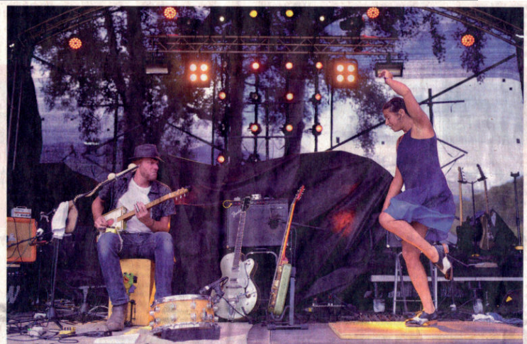
Sur scène, One Rusty Band offre un spectacle musical et visuel où des accords vintage se marient à un show de claquettes. DEITCH/EESE DAVID ZURER

Pour One Rusty Band, tout a commencé dans les rues de Toulouse. Greg, musicien, y