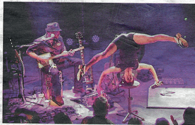
One Rusty Band, un show renversant samedi au Novomax.

vient à créer de la densité, donner de la chair au show. Le duo morbihannais s'amuse sur ses propres compos, tout en glissant une reprise, « Come on, Come Over », chère à Jaco Pastorius. Barbe fournie à la ZZ Top, Ray chante et « gratte » avec force. Son complice, Oliv', un batteur carrément heavy-rock, n'est pas en reste et finit par arracher son propre « marcel ». Qui oserait dire que le blues-rock n'est pas une affaire de sueur ?